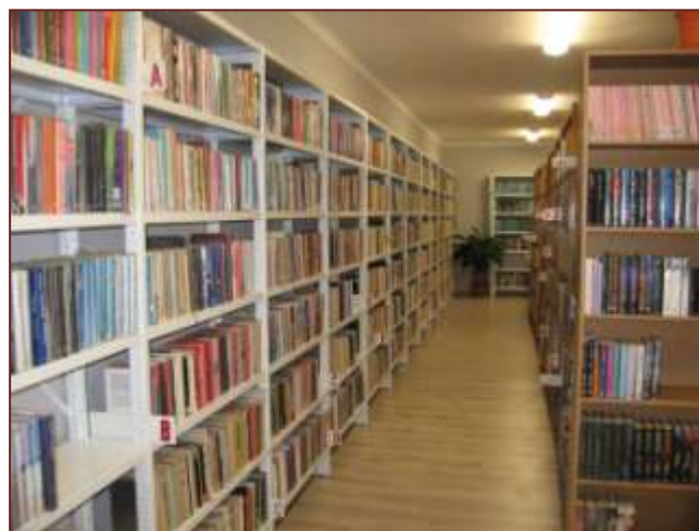
uloženie nových bielych regálov