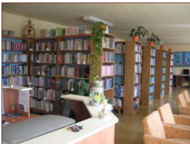
uloženie pôvodných regálov