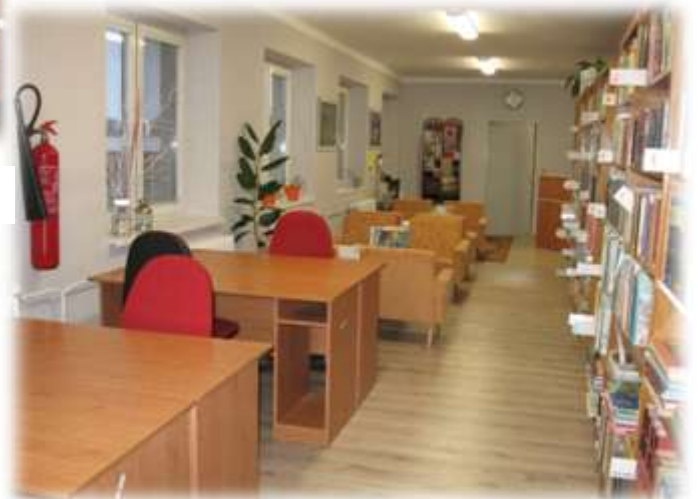
nový priestor - podlaha, osvetlenie